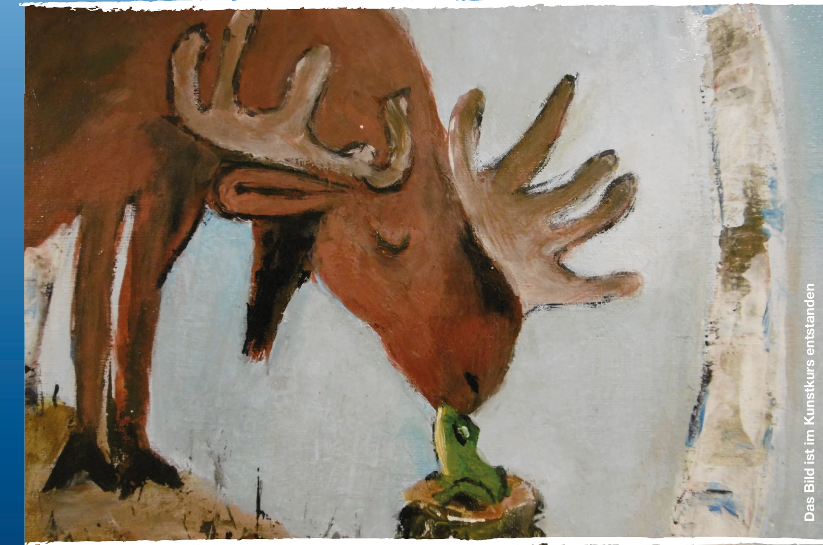
Das Bild ist im Kunstkurs entstanden